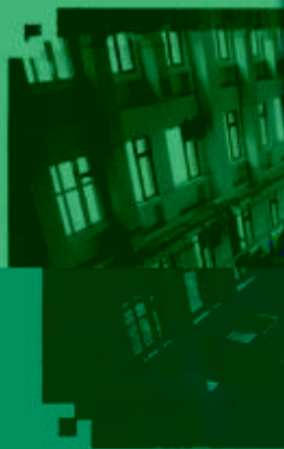
CNC 数控技术 训练场所